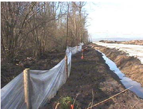
Barrière en phase chantier