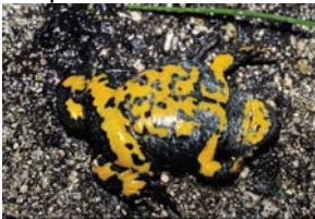
Crapaud sonneur à ventre jaune